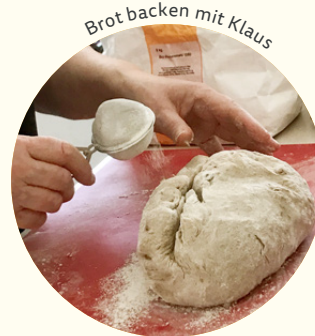
Brot backen mit Klaus