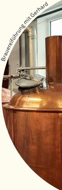
Brauereiführung mit Gerhard