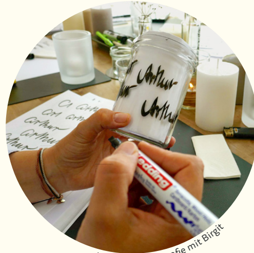
Kerze und Kalligrafie mit Birgit